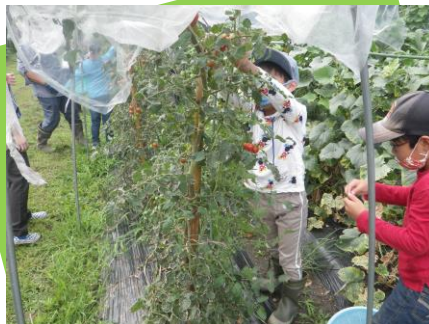
ミニトマトの収穫