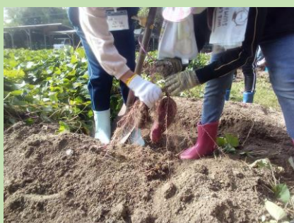
サツマイモの収穫