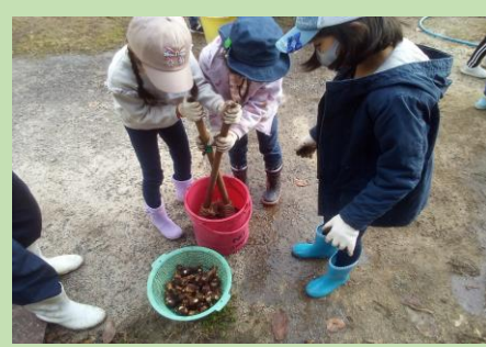
里芋の収穫とイモ洗い体験