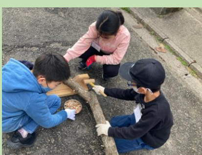
シイタケのコマ打ち