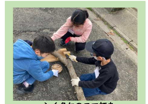
シイタケのコマ打ち