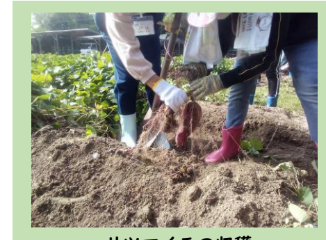
サツマイモの収穫