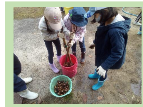
里芋の収穫とイモ洗い体験