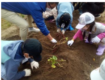
サツマイモの収穫