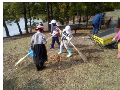
鳥羽池で落ち葉拾い