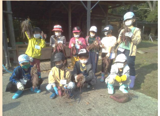
サツマイモ収穫後の記念撮影