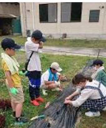
サツマイモの植付