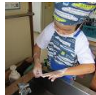
● 手洗いの仕方を学びました。