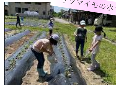
サツマイモの水やり

←キンカンの木の下の草とりは係りのみんなでやったので、自分もがんばろうとおもいました。