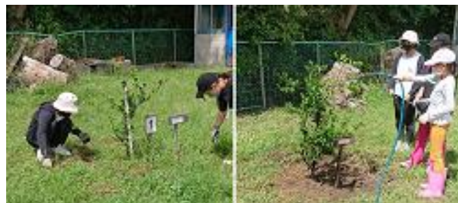
菜園係：果樹の手入れ

初めてやったことは、やぎやうさぎにえさをやったりさわったことです。動物係みんなで活動したことが楽しかった。