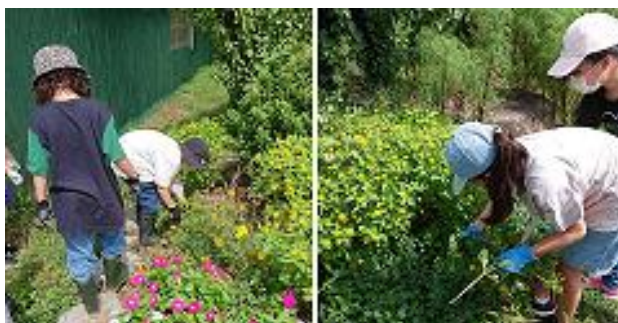
活動2：花壇の手入れ