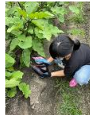
菜園係：ナスの収穫