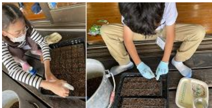
菜園係：秋野菜のポット作り

クリ拾いでとげがささり痛かったけれど、けがはしませんでした。このメダカは指をいれるとよってきたのでびっくりしました。