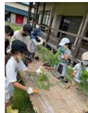
菜園係：人参の収穫