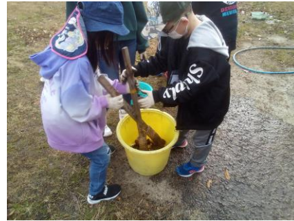
里芋のイモ洗い棒体験