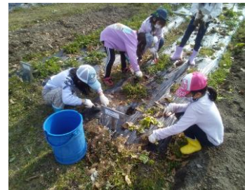
畑の手入れ（草取り）