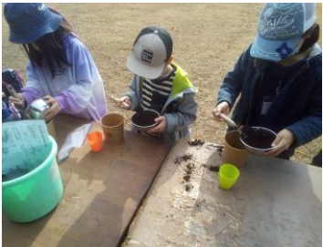
玉ねぎ苗の手入れ