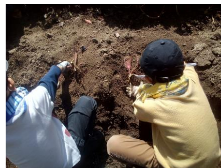
大きな芋が掘れました