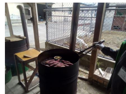
石焼き芋の焼き方を学ぶ