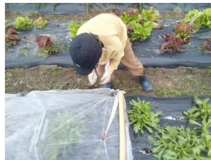
畑の野菜に肥料をまく