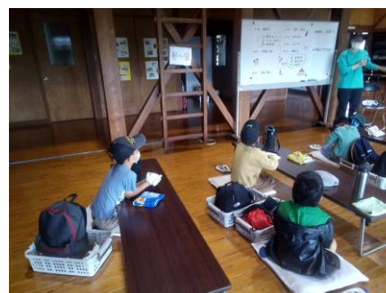
自分の係を決める