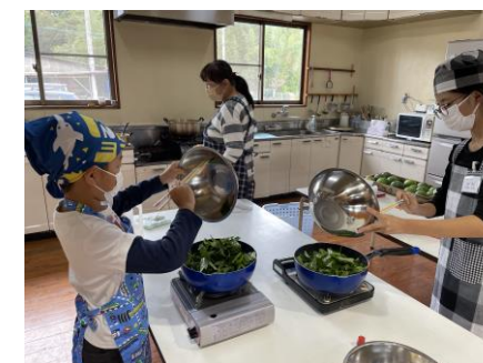
フライパンの使い方を学ぶ