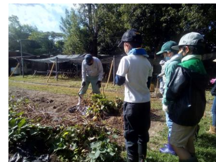
サツマイモの掘り方を学ぶ