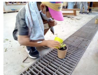
レタスポットに水やり