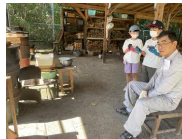
石焼き芋の説明練習