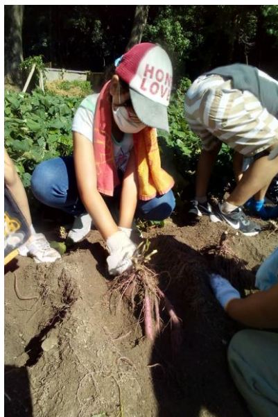
サツマイモの収穫