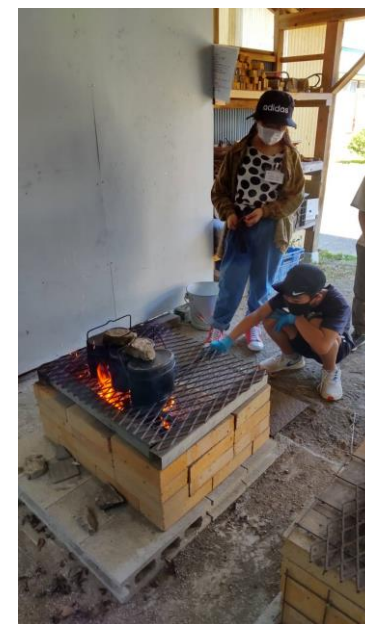
飯ごうでご飯炊き