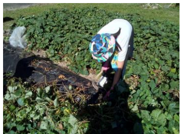
上級生が鎌を使ってツル切り