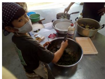
空心菜の胡麻和え作り