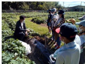
鎌の使い方の指導