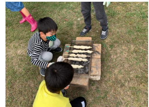
自分の分が焦げないように