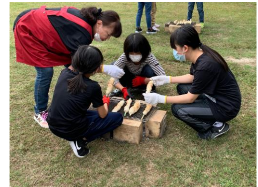
いい感じに焼けてます