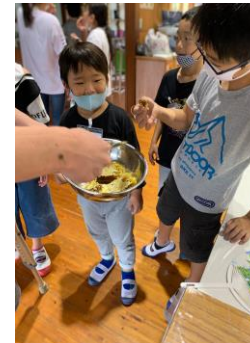
ハチの巣を食べる