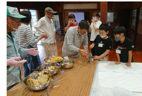
ジューサーでハチミツを絞る