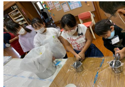
ジューサーでハチミツを絞る