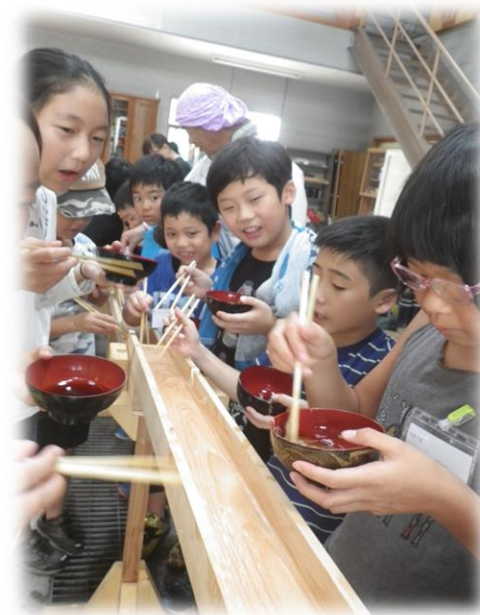
ヒノキのそうめん流し