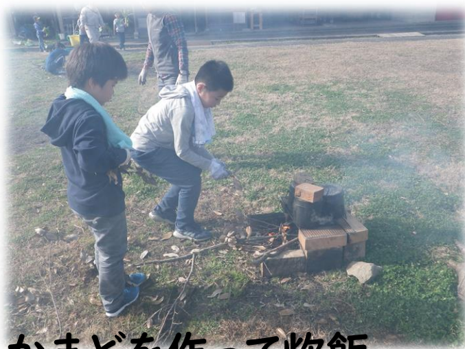
かまどを作って炊飯