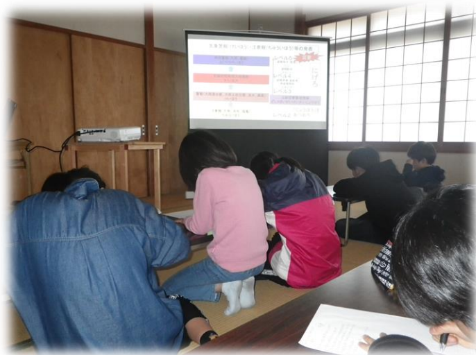
災害についての講演