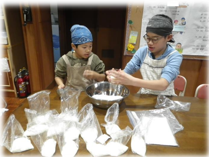
ビニール袋をつかった炊飯